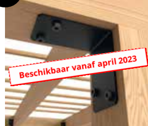
8 Verbindingshoekijzer 135°