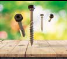
Schroeven voor verbinders