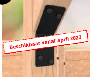
8 Verbindingshoekijzer 135°