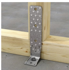
Bevestiging balk op betonplaat