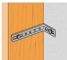
Fixation bois/ support rigide